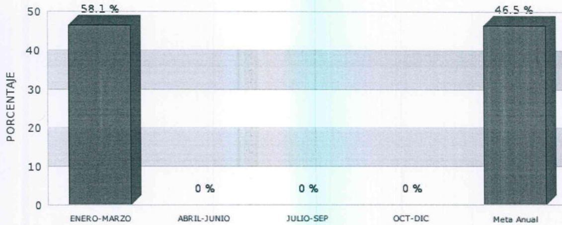
Gráfica de Indicador Porcentaje de mujeres que visitan las instalaciones